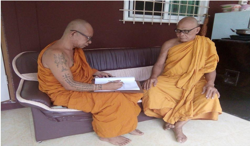
สัมภาษณ์, สัมภาษณ์พระอธิการแอ้ มหาปณฺโญ เจ้าอาวาสวัดวาสุกรรมมณีท่า บ้านหาดคำ, หมู่ที่ ๒ ,ตำบลหาดคำ,อำเภอเมือง,จังหวัดหนองคาย.