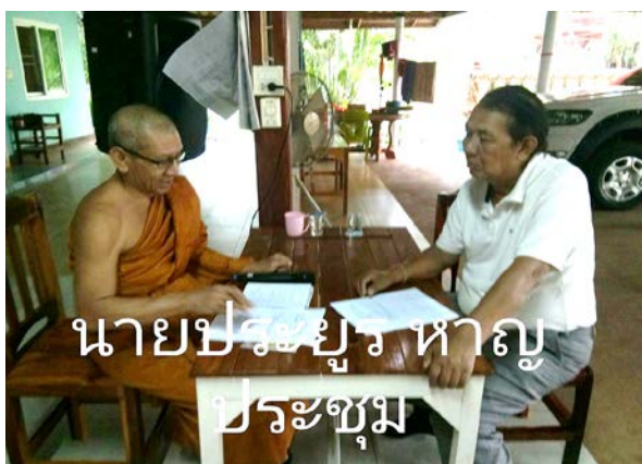
สัมภาษณ์ นายประยูร (นามสมมติ), ๒๖ หมู่ ๑๓ บ้านนาคำแก้ว ตำบลนาข่า อำเภอเมือง จังหวัดอุดรธานี, ๑๘ เมษายน ๒๕๖๑.